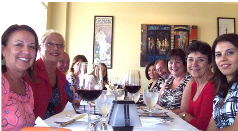
First 'Table Française' of the year in Jacksonville - taking advantage of their Julie and Julia special. Hope to share a glass of wine with each of you at our fall meeting.

and includes such items as mots-croisés, children's sections, and more. France-Amérique, «le journal français des Etats-Unis,» is a more general publication and also offers daily updates, features, etc. Check them out!